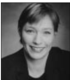
Henriette Kjær Socialminister

Indsatsen over for de svageste i samfundet er et fælles ansvar. Jeg er overbevist om, at vi ved en fælles indsats fra både offentlig og privat side kan skabe bedre forhold for dette samfunds mest udsatte borgere. Det fortjener de alle. Ikke mindst børnene, som ellers ikke får en fair chance for et godt liv.